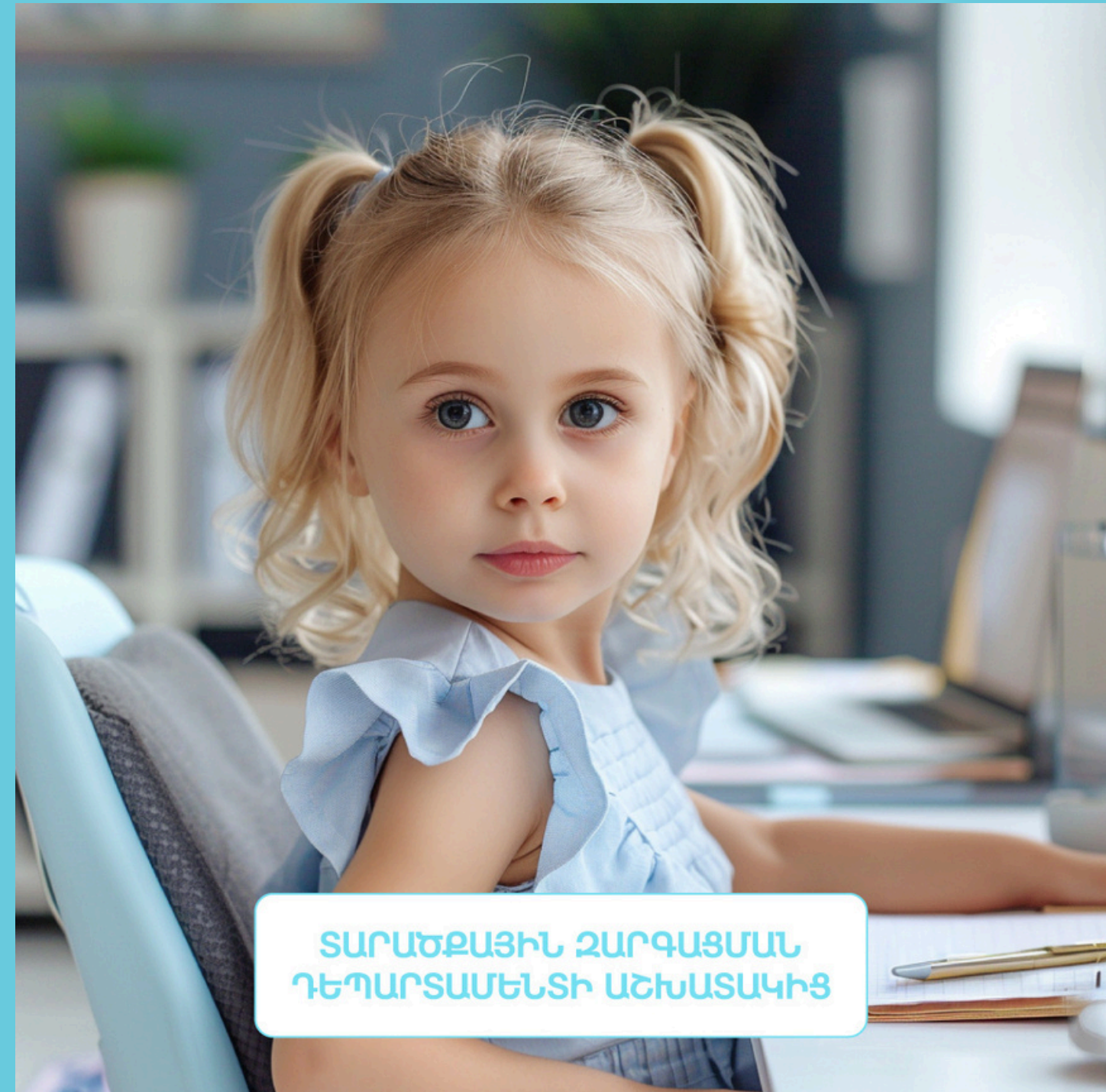
Employee of the risk management and control department

ՏԱՐԱԾՔԱՅԻՆ ԶԱՐԳԱՑՄԱՆ ԴԵՊԱՐՏԱՄԵՆՏԻ ԱՇԽԱՏԱԿԻՑ