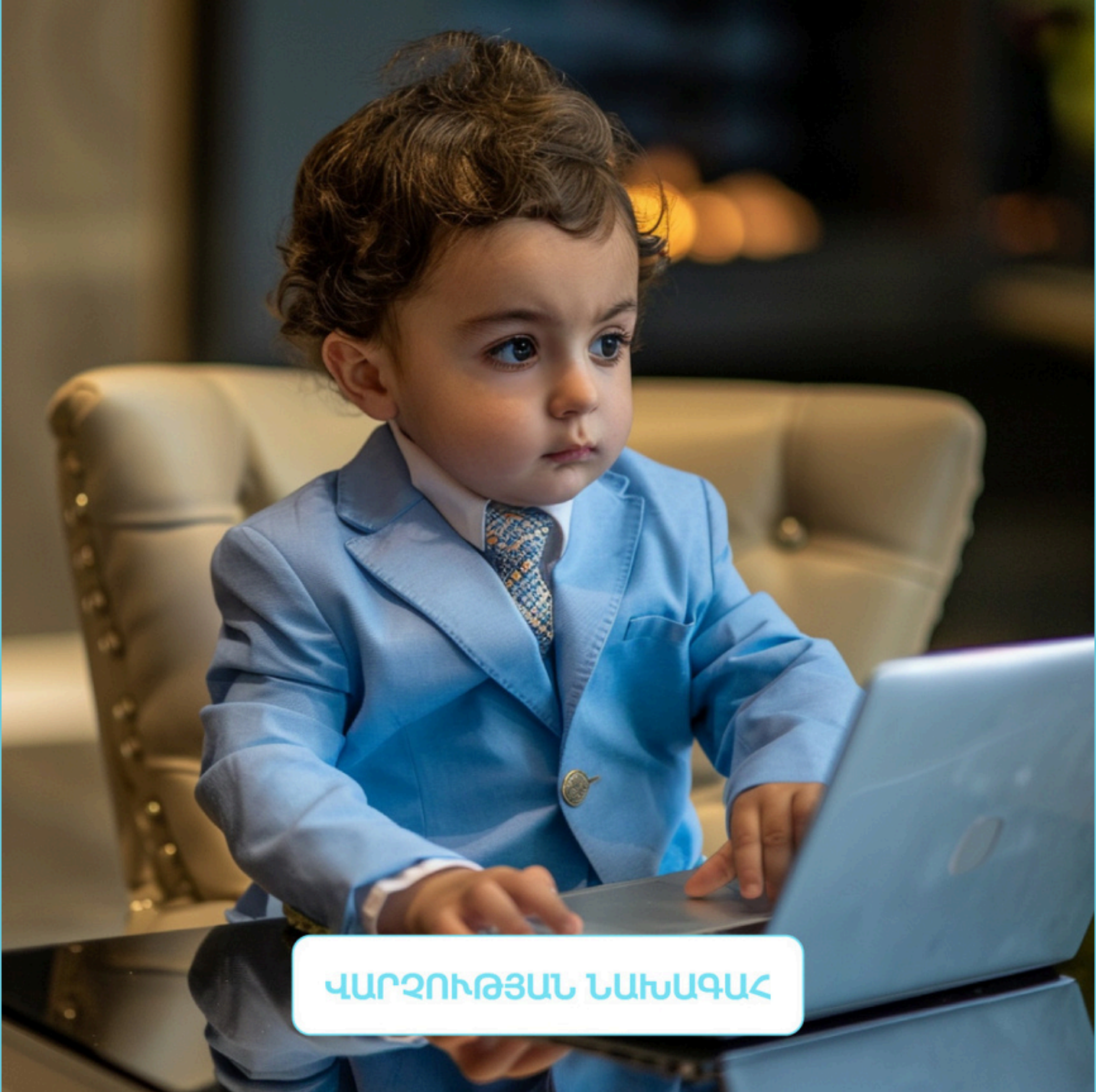
Chief Financial Office